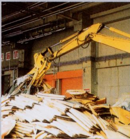
現場作業中の IRON CLAW-L